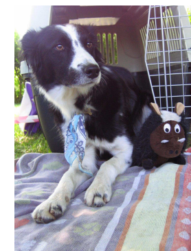
MAYA - Border Collie