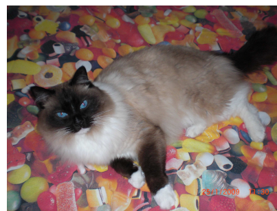
GHIBLI – Ragdoll