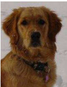
CANDY – Golden Retriever