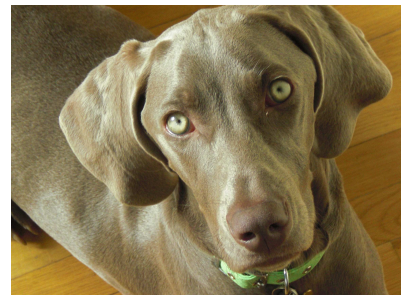
RAJI - Weimaraner