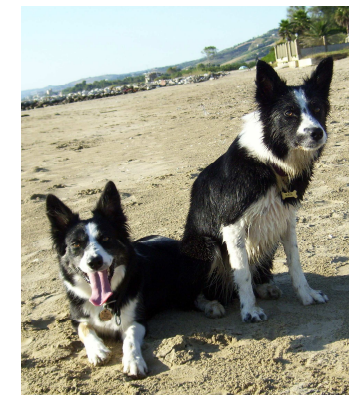
MAYA & FIONA - Border Collies