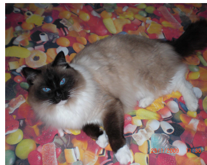
GHIBLI – Ragdoll